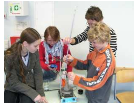
Klasse 7: Naturwissenschaftliche Methoden – Genaues Abmessen von Flüssigkeiten