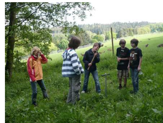
Klasse 8: Bodenanalyse auf dem Remstecken