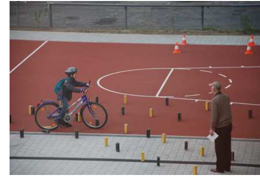
Klasse 5: Geschicklichkeitsparcours

Der Ansprechpartner für das jeweilige Projekt (s. Liste!) informiert Sie über den Planungsstand und das weitere Vorgehen!