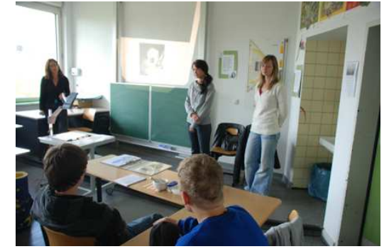
Klasse 10: Sensorik-Kurs mit Studentinnen der Uni Koblenz